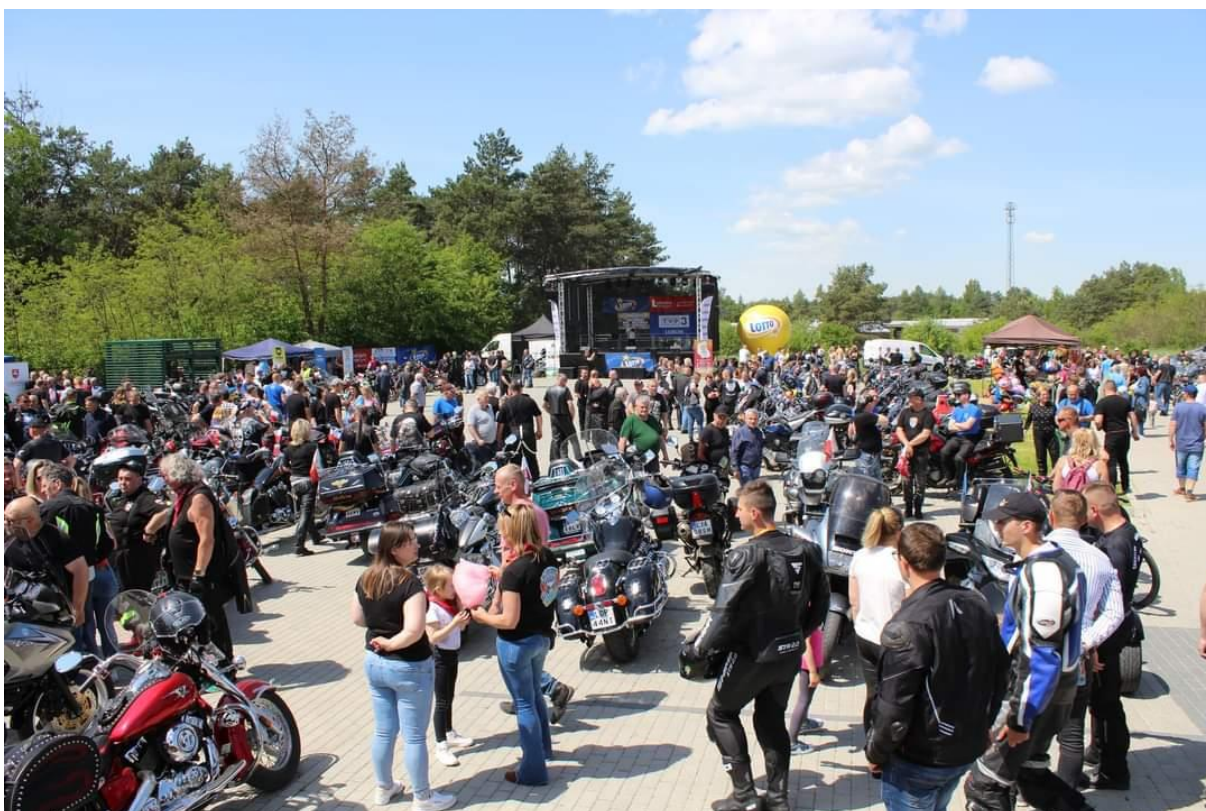
Zdjęcie 18 Pierwszy Chodelski Piknik Motocyklowy „Motoraki” 2023