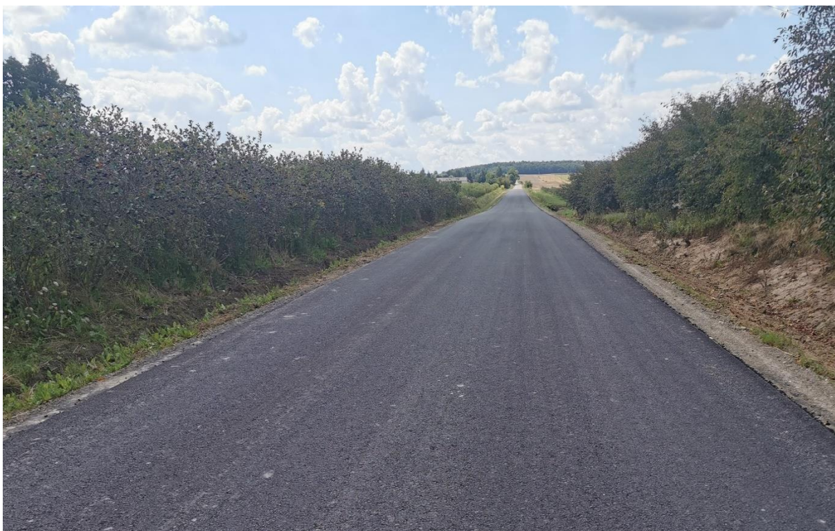
Zdjęcie 6 Remont i przebudowę drogi gminnej nr 107060L dr. pow. 2248L – Stasin – Ludwinów – Przedm. Rankowskie