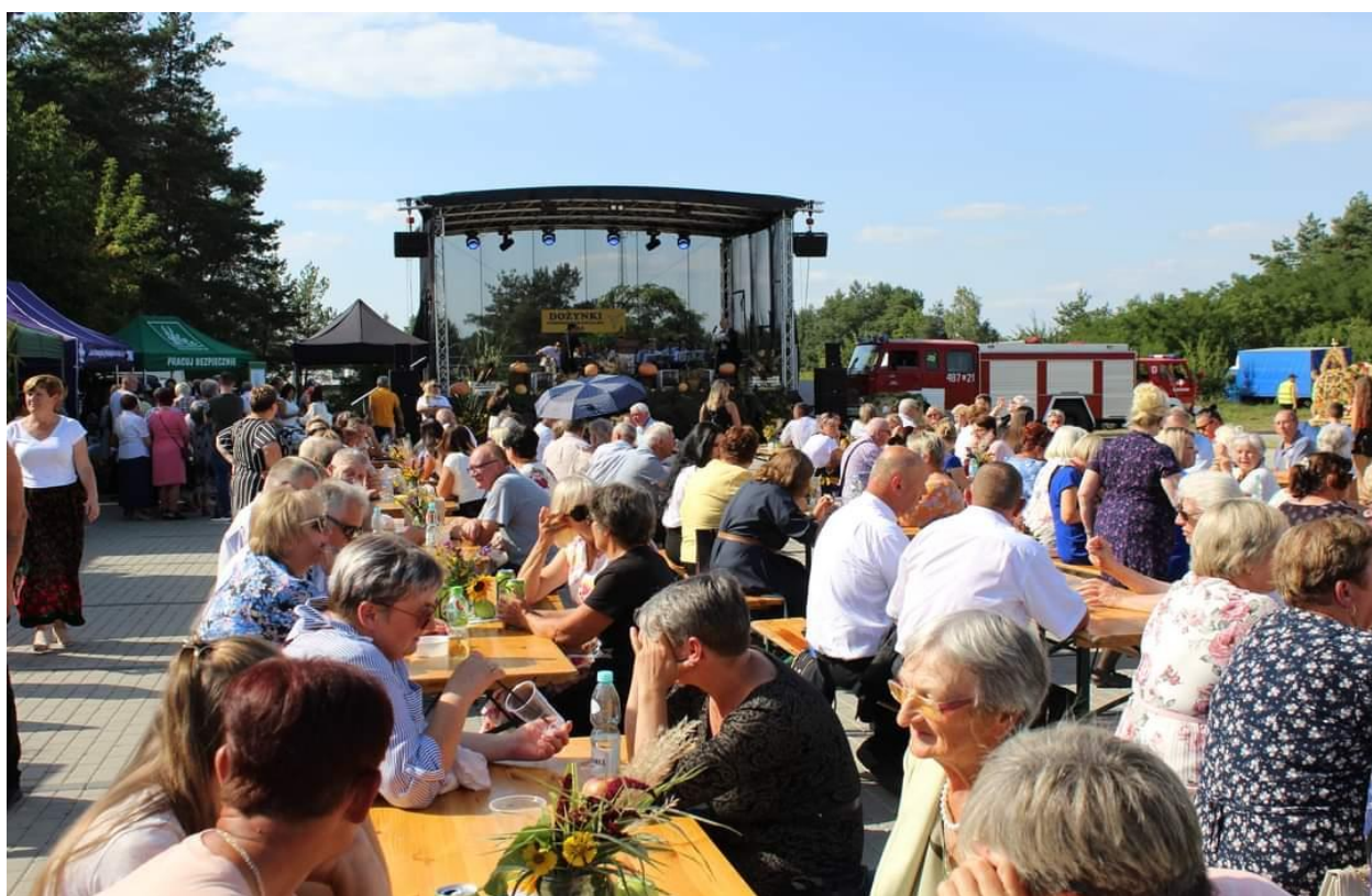
Zdjęcie 16 Dożynki Gminne 2023 r.