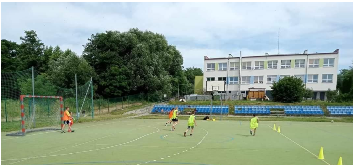
Zdjęcie 19 Zajęcia sportowe – Wakacje z GOK Chodel 2023 r.