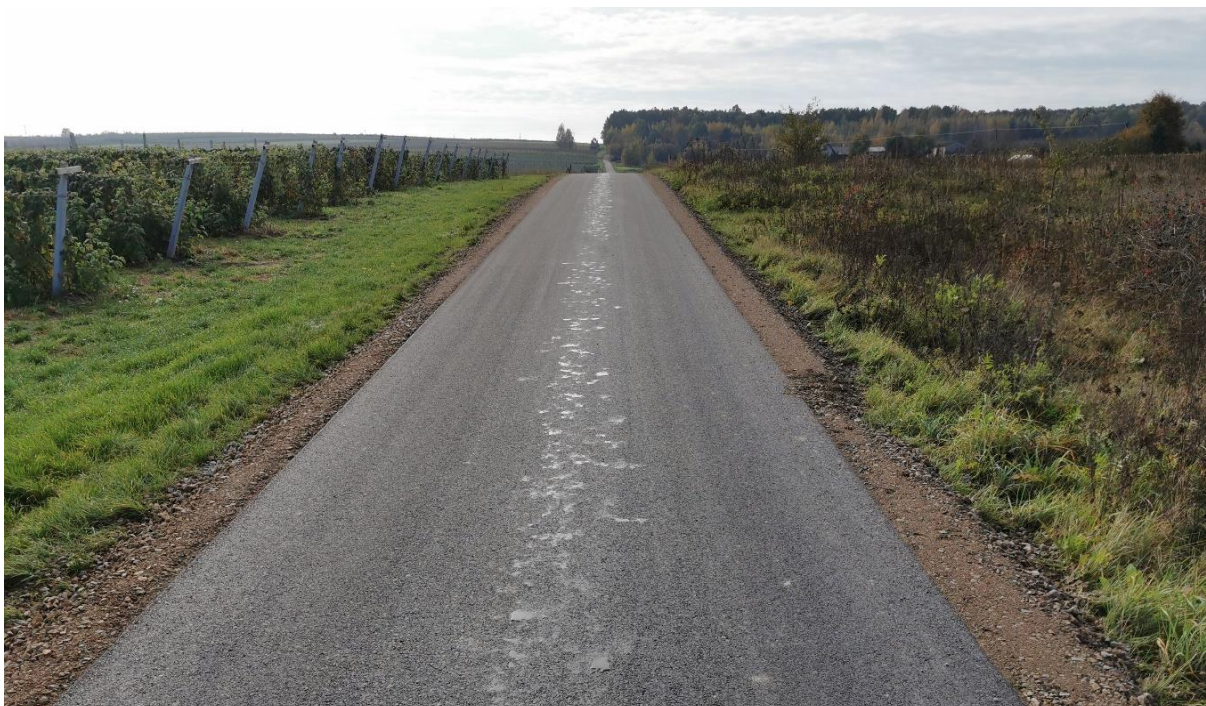
Zdjęcie 8 Modernizacja (przebudowa) drogi dojazdowej do gruntów rolnych o długości 850,00 m w m. Ratoszyn Pierwszy