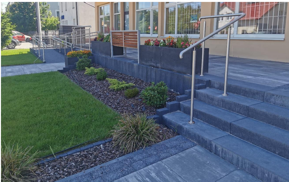
Zdjęcie 10 Wykonanie podjazdu dla osób niepełnosprawnych oraz remont nawierzchni przy budynku Urzędu Gminy Chodel