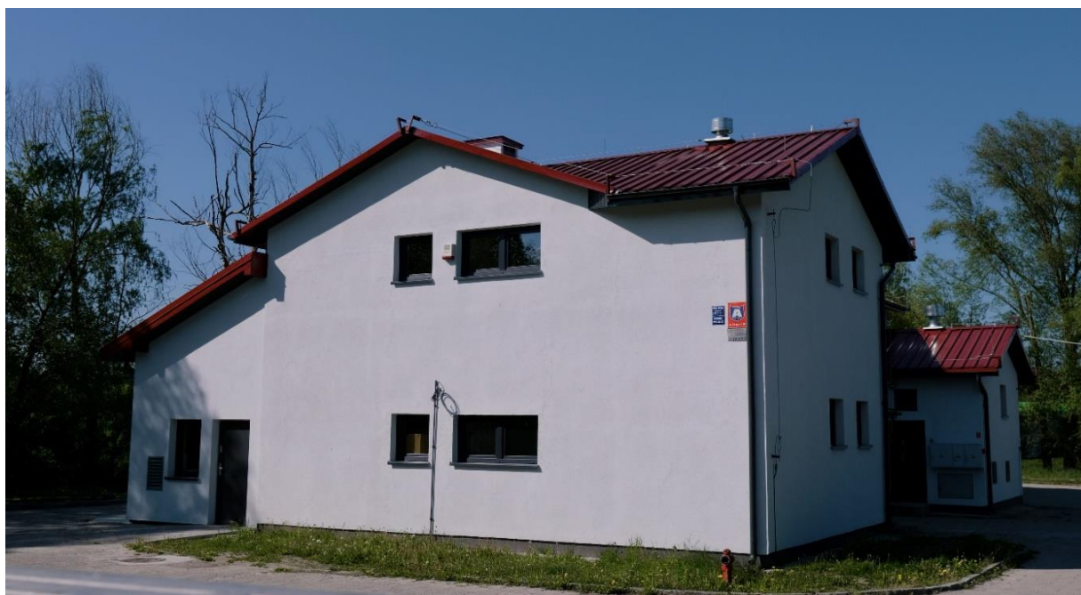
Zdjęcie 14 Rozbudowa oraz przebudowa oczyszczalni ścieków