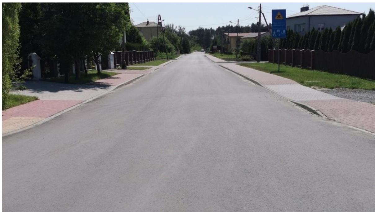
Zdjęcie 13 Remont ul. Ściegiennego (wraz z ul. Piaskową)

a. Remont ul. Ściegiennego od skrzyżowania z ul. Partyzantów do końca zabudowy.