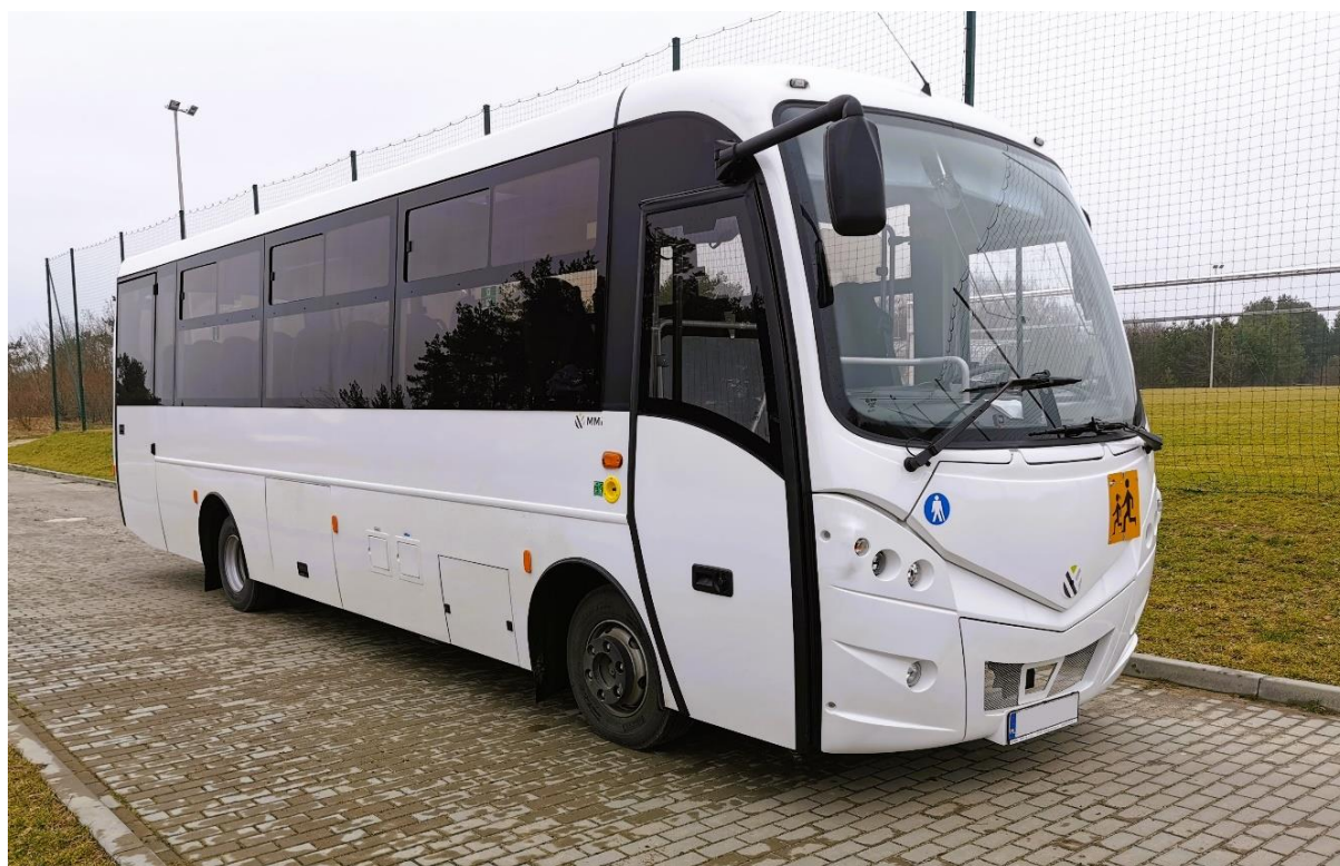
Zdjęcie 11 Zakup autobusu szkolnego na potrzeby dowozów uczniów szkół podstawowych na terenie Gminy Chodel