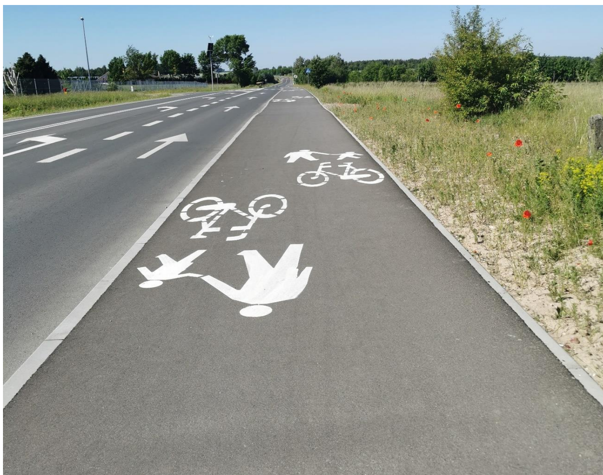
Zdjęcie 15 Przebudowa drogi gminnej ul. Godowska w m. Chodel - wraz z budową ciągu pieszo-rowerowego