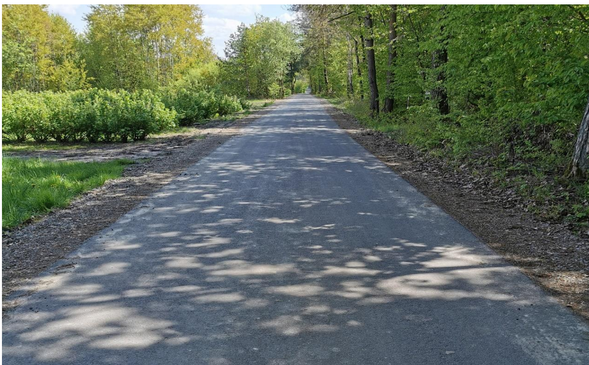
Zdjęcie 7 Przebudowa drogi gminnej nr 108154L w miejscowości Książ