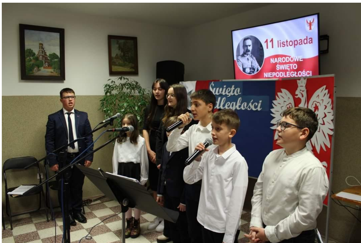
Zdjęcie 20 Program Artystyczny – Narodowe Święto Niepodległości 2023