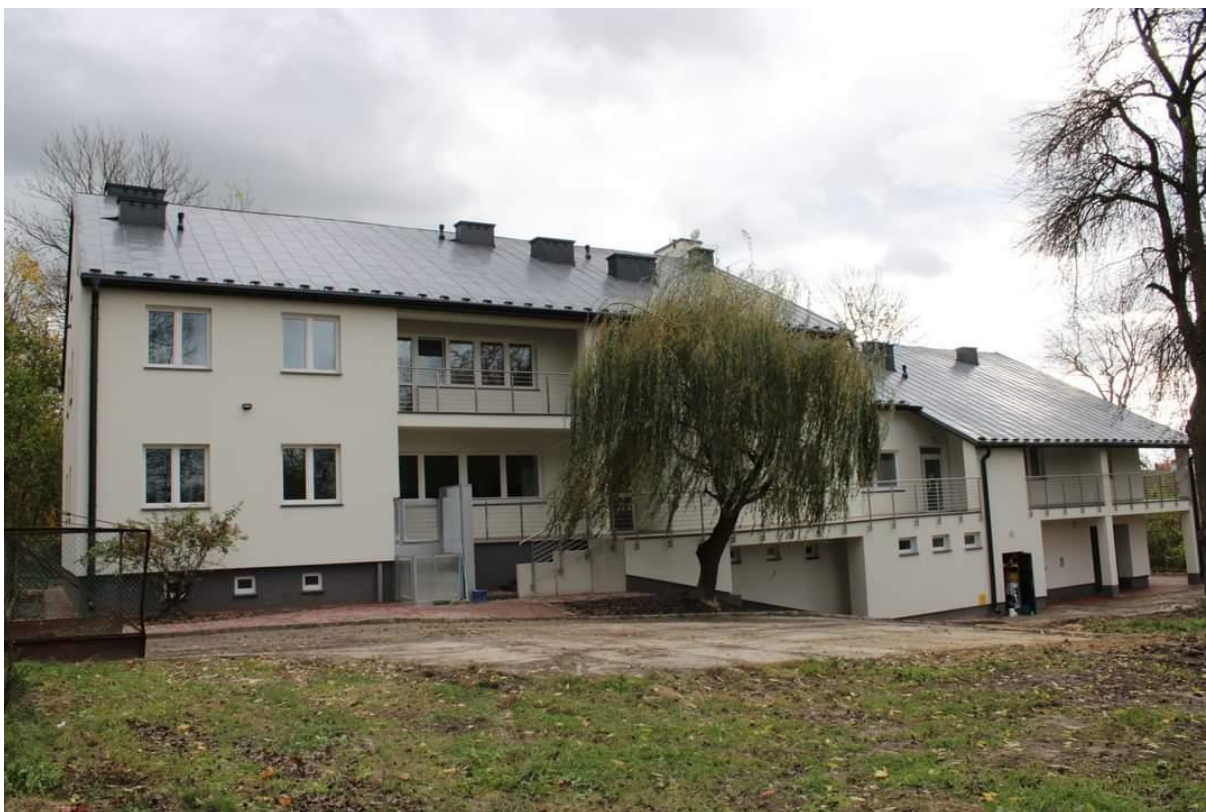
Zdjęcie 9 Termomodernizacja i remont budynku gminnego w Ratoszynie Drugim