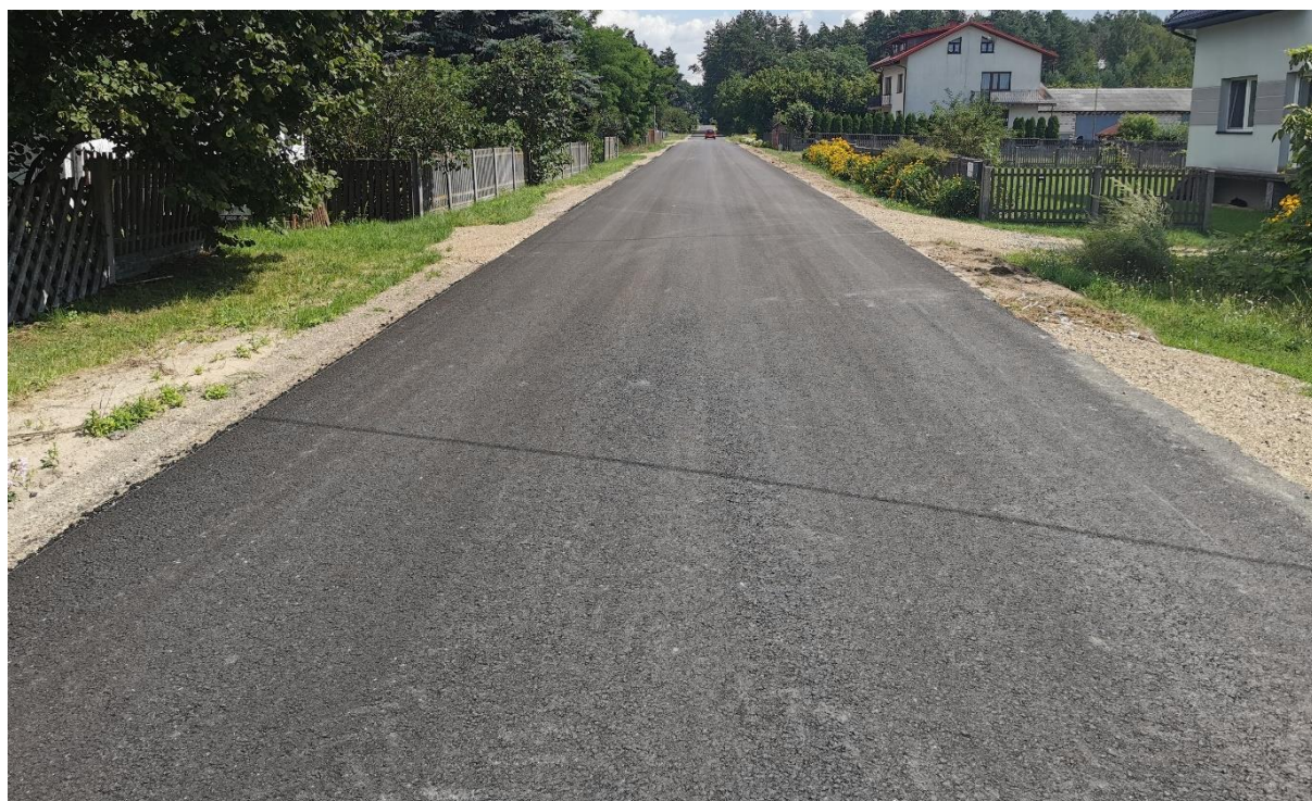
Zdjęcie 5 Remont drogi gminnej nr 108154L Dębiny – Sewerynowka – Siewalka – dr. gm. 108237L we wsi Książ