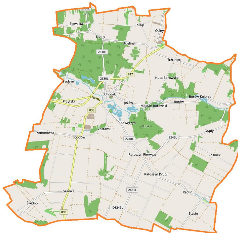
Rysunek 1 Położenie poszczególnych miejscowości na terenie Gminy Chodel

W skład Gminy wchodzi 26 miejscowości: Adelina, Antonówka, Budzyń, Borów, Borów-Kolonia, Chodel, Granice, Grądy, Godów, Huta Borowska, Jeźów, Kawęczyn, Książ, Majdan Borowski, Osiny, Lipiny, Przytyki, Radlin, Ratoszyn Pierwszy, Ratoszyn Drugi, Siewalka, Stasin, Świdno, Trzciniac, Zastawki, Zosinek. Tworzą one 25 sołectw.