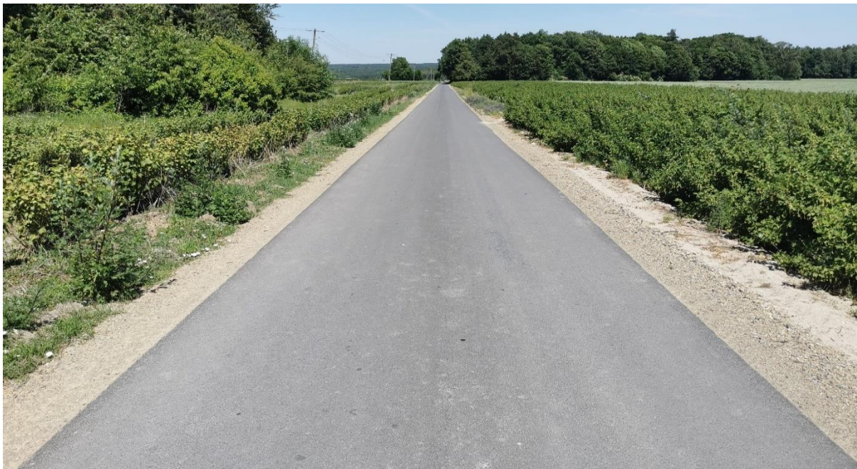
Zdjęcie 4 Przebudowa drogi gminnej nr 108275L dr. pow. 2247L Kol. Borów – dr. pow. 2245L - Grądy