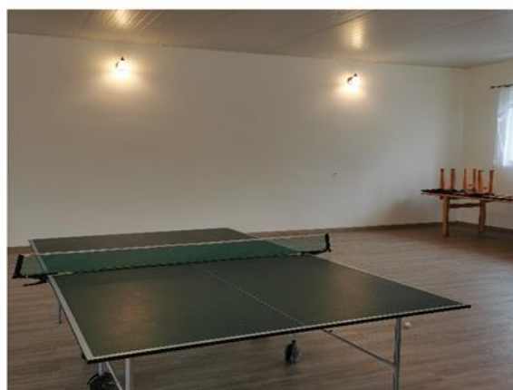
Zdjęcie 1 Dostosowanie budynków świetlicy wiejskiej w Lipinach i Adelinie do potrzeb społeczno-kulturalnych