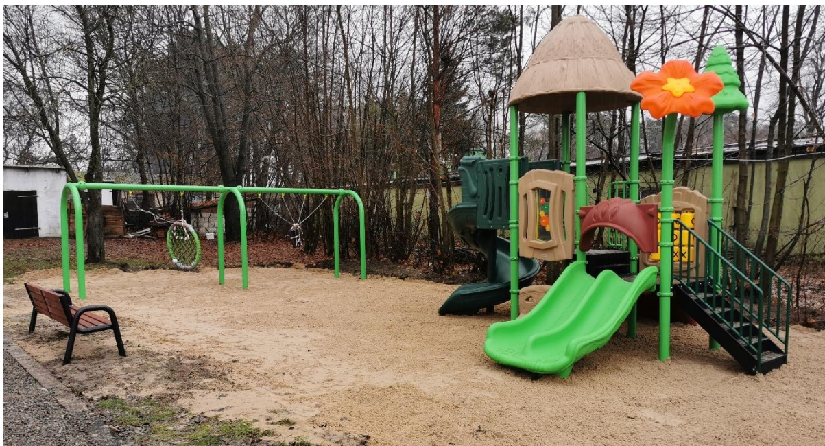
Zdjęcie 12 Budowa placu zabaw we wsi Trzciniec