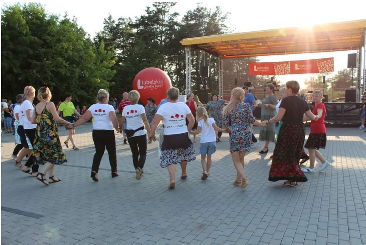
Zdjęcie 17 Piknik „Bezpieczna Rodzina” 2023