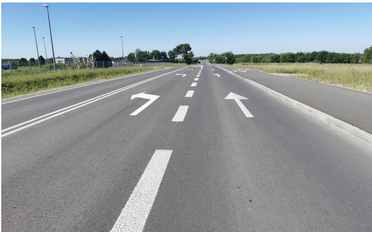
Zdjęcie 2 Przebudowa drogi gminnej ul. Godowska w m. Chodel (dawna DW833)