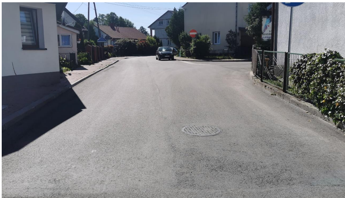
Zdjęcie 3 Przebudowa drogi gminnej ul. Kościelna w m. Chodel